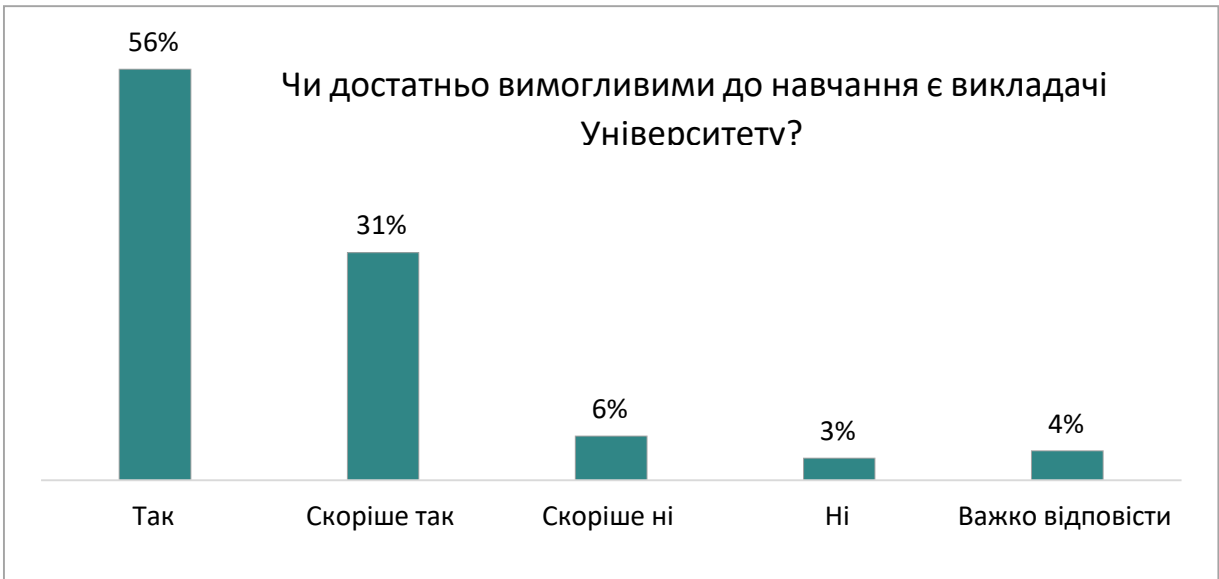
Оцінка студентами рівня вимогливості викладачів

процесу, зокрема рівень вимогливості та професіоналізму викладачів і рівень задоволеності навчанням в Університеті.