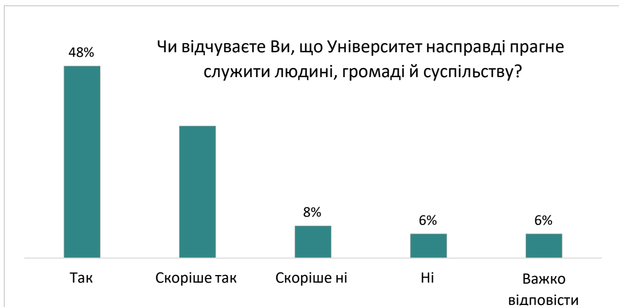
Оцінка студентами реалізації місії Університету

Позитивні результати опитування засвідчують, що обрана стратегія розвитку корпоративної культури є важливим чинником удосконалення усіх напрямків діяльності Університету. Саме тому в опитуванні студентів нас також цікавили аспекти, що безпосередньо стосуються освітнього