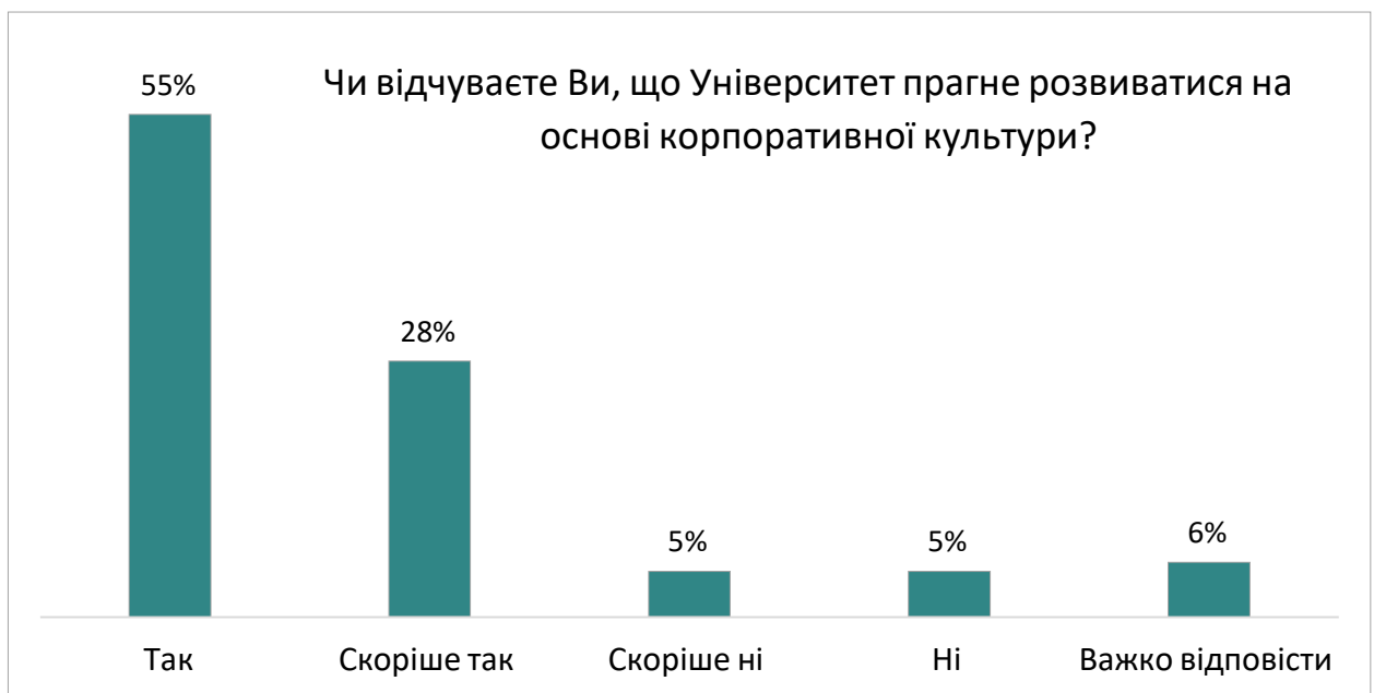
Вплив корпоративної культури на студентів

В опитуванні студентів 3 курсів Університету нас цікавило чи відчують студентами вплив корпоративної культури. З діаграми наведені нижче ми бачимо, що 83 % третьокурсників відчують те, що Університет прагне розвиватися на основі корпоративної культури. Це має безпосередній стосунок до освітнього процесу.