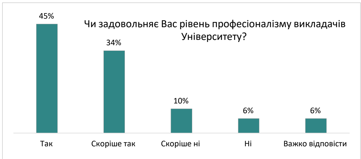
Оцінка студентами рівня професіоналізму викладачів

Як видно з діаграми, переважна більшість студентів (87%) впевнені, що викладачі Університету є достатньо вимогливими, 79% задоволені рівнем професіоналізму викладачів.