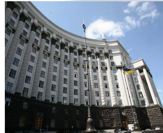
Нормативно - правові акти