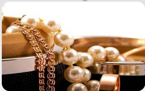
Речі індивідуального користування