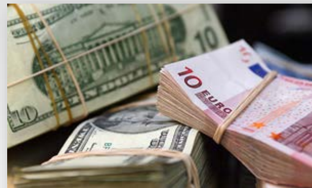
Кошти, одержані як відшкодування