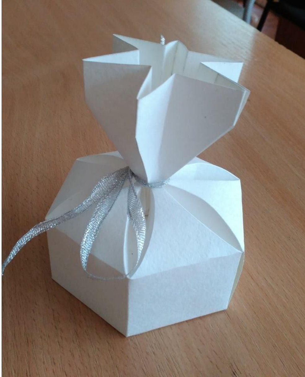
Приклад виконаного завдання зі створення конструкції та макету упаковки