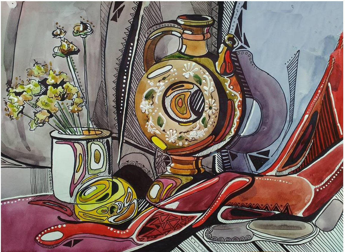
Завдання з живопису та композиції «Декоративний натюрморт»