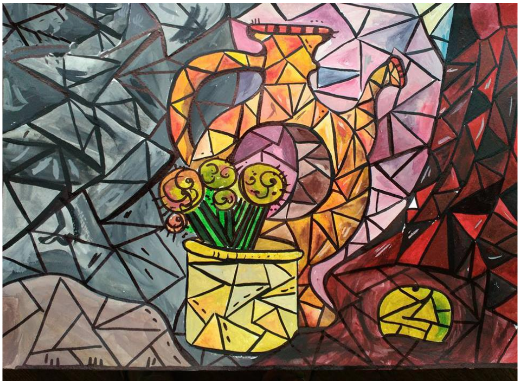
Завдання з живопису та композиції «Декоративний натюрморт»