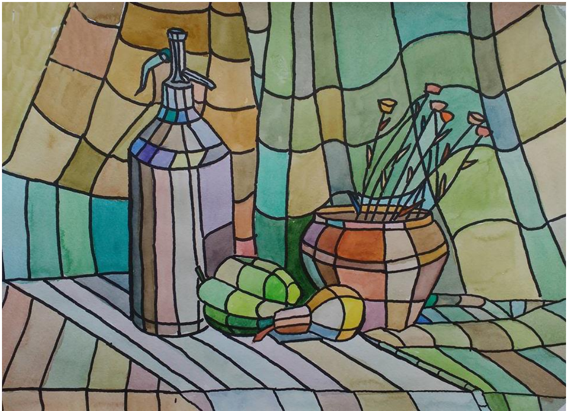
Завдання з живопису та композиції «Декоративний натюрморт»