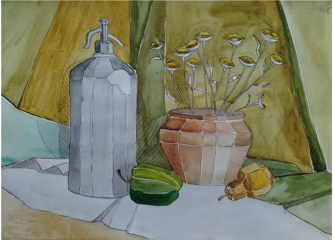
Завдання з живопису та композиції «Декоративний натюрморт»