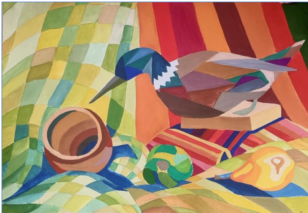
Приклад, виконаного завдання з декоративної стилізації.