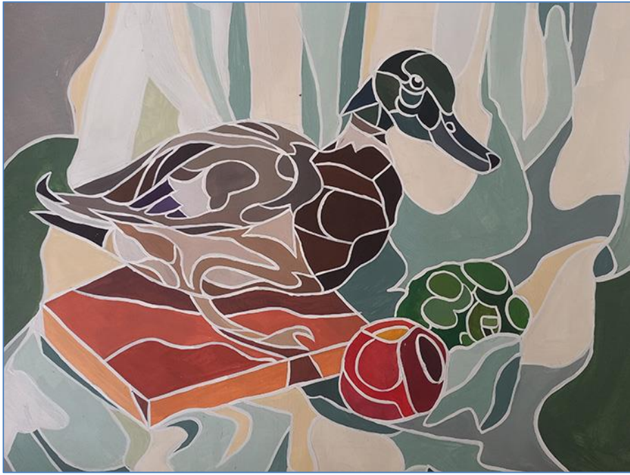
Приклад, виконаного завдання з декоративної стилізації.