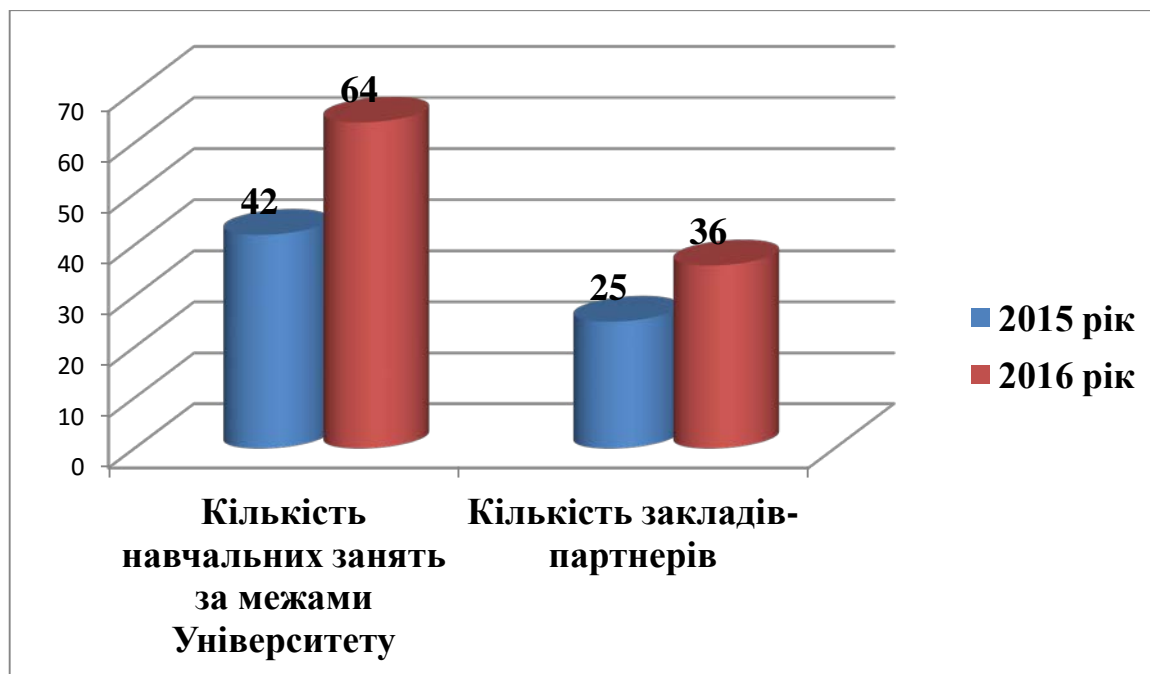
Рис. 2. Розширення освітнього простору в Педагогічному інституті

Зкладами-партнерами, де проводяться семінарські і практичні заняття зі студентами Педагогічного інституту є «Експериментаніум. Музей популярної