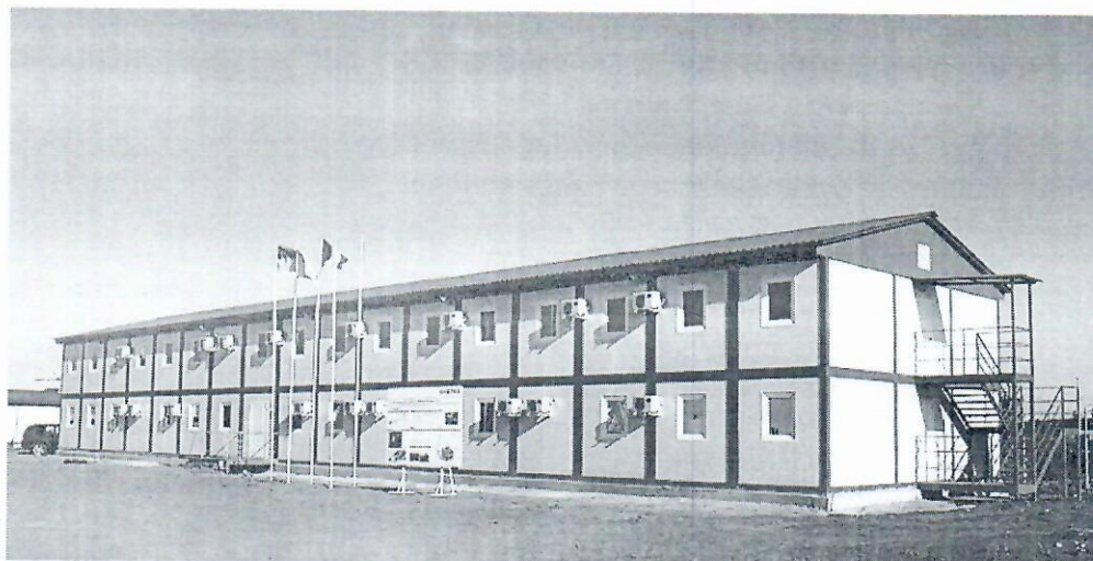
Орієнтовний вигляд будівлі*