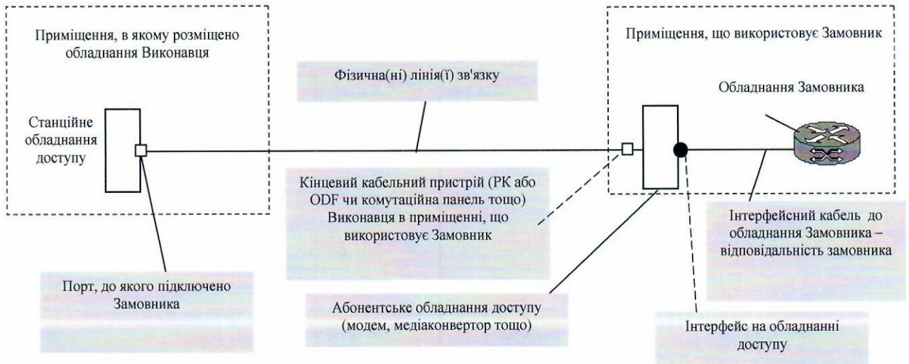
Рис. Конфігурація та схема надання Послуги Інтернет (у разі інших умов підключення рисунок змінюється відповідно до домовленостей з Замовником)

4.2.3. Підключити та налаштувати власне обладнання і відповідати за його функціонування, включаючи технічне обслуговування та відповідність вимогам стандартів України.